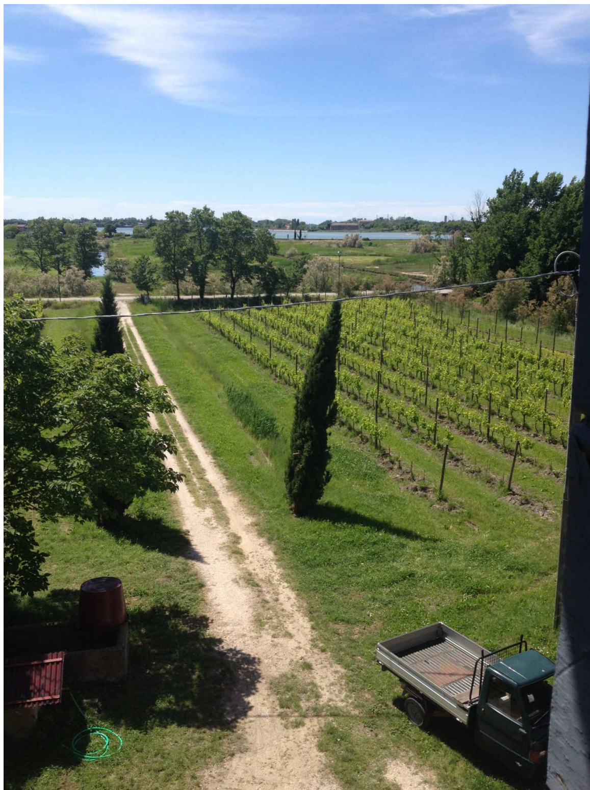
Photo 5 : Système de drainage pour lutter contre la salinité des sols