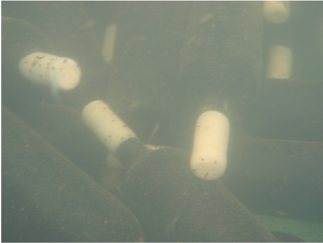
Photo 9 : bouteilles d'Orto di Venezia en attente au fond de la lagune de San Erasmo

Avec ses vignes non greffées, le domaine possède une autre particularité : après l'élaboration du vin en cuves, il n'y a pas d'élevage en barriques (cf. peu d'arômes de bois) ; toutefois, les bouteilles séjournent au fond de la lagune de Venise pour un vieillissement ménagé avant d'être commercialisées (Photo 9).