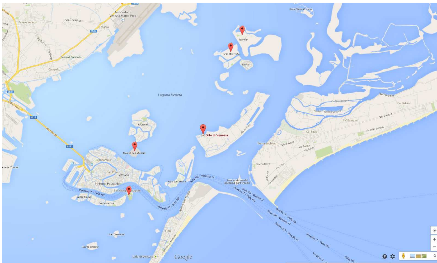
Annexe 1 : Le vignoble dans la lagune de Venise.