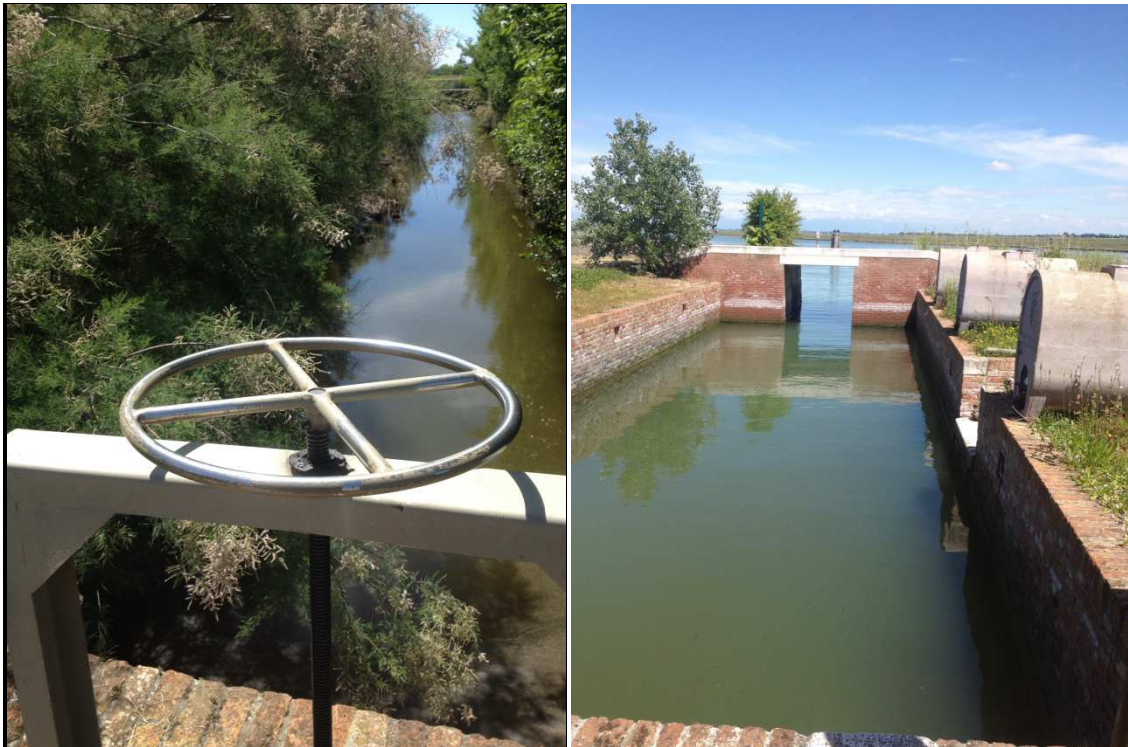
Photos 6 et 7 : aboutissement du canal collecteur d'eau douce sur la lagune et son système de vannes qu'on ouvre à marée basse.

La vigne plantée ici est en francs-pieds car le milieu saumâtre empêche le phylloxera. Sur les conseils d'Alain Graillet, producteur à Croze-Hermitage, 3 types de cépages italiens traditionnels ont été choisis : la malvoisie d'Istrie, le vermantino et le fiano d'Avellino.